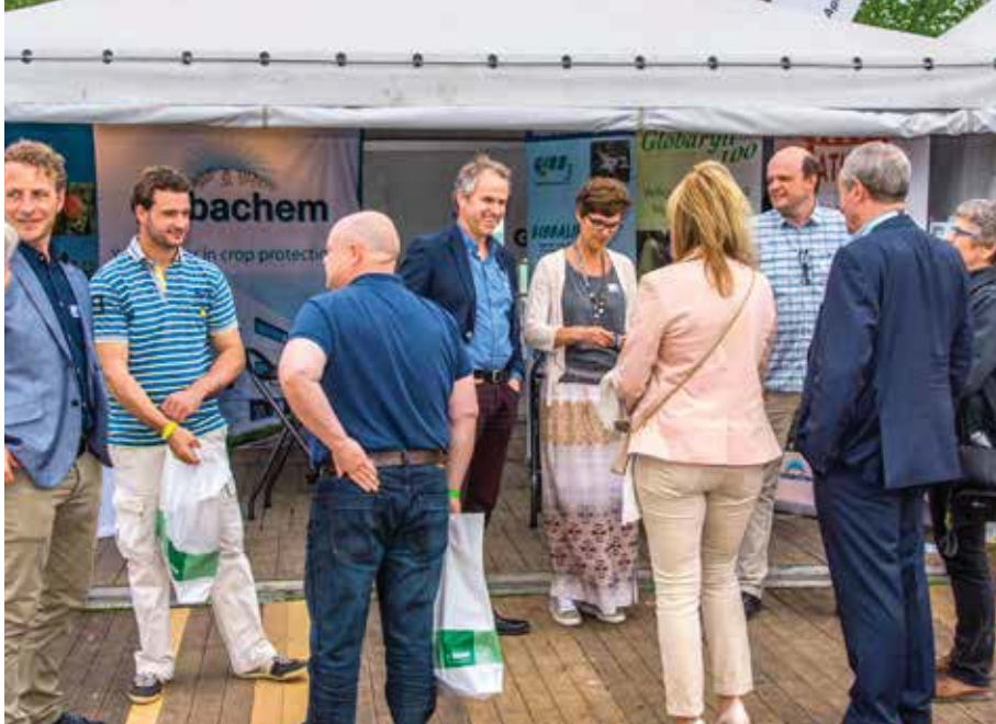
Globachem, trouwe sponsor van de Werktuigendagen, tijdens de editie 2017

“We dromen ervan om het probleem van lentenachtvorst op te lossen en hopen volgend jaar ons nieuwe product tegen zonnebrand te lanceren.”