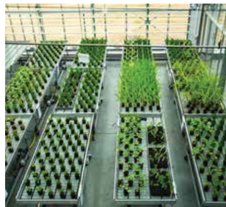
Foto 1. - Globachem Greenovation Center te Sint-Truiden