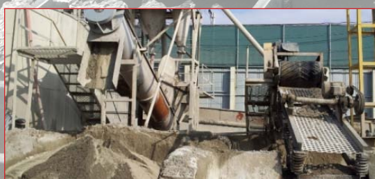
Betonrec Recykling Betonu