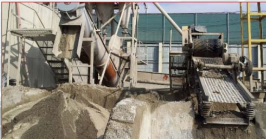
Betonrec Recykling Betonu