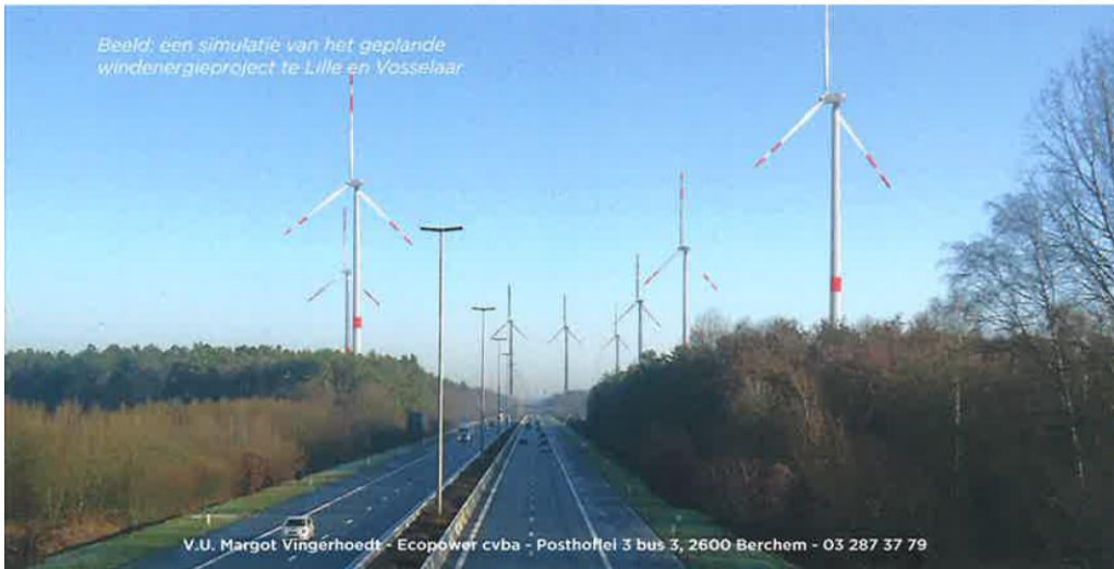
Beeld: een simulatie van het geplande windenergieproject te Lille en Vosselaar