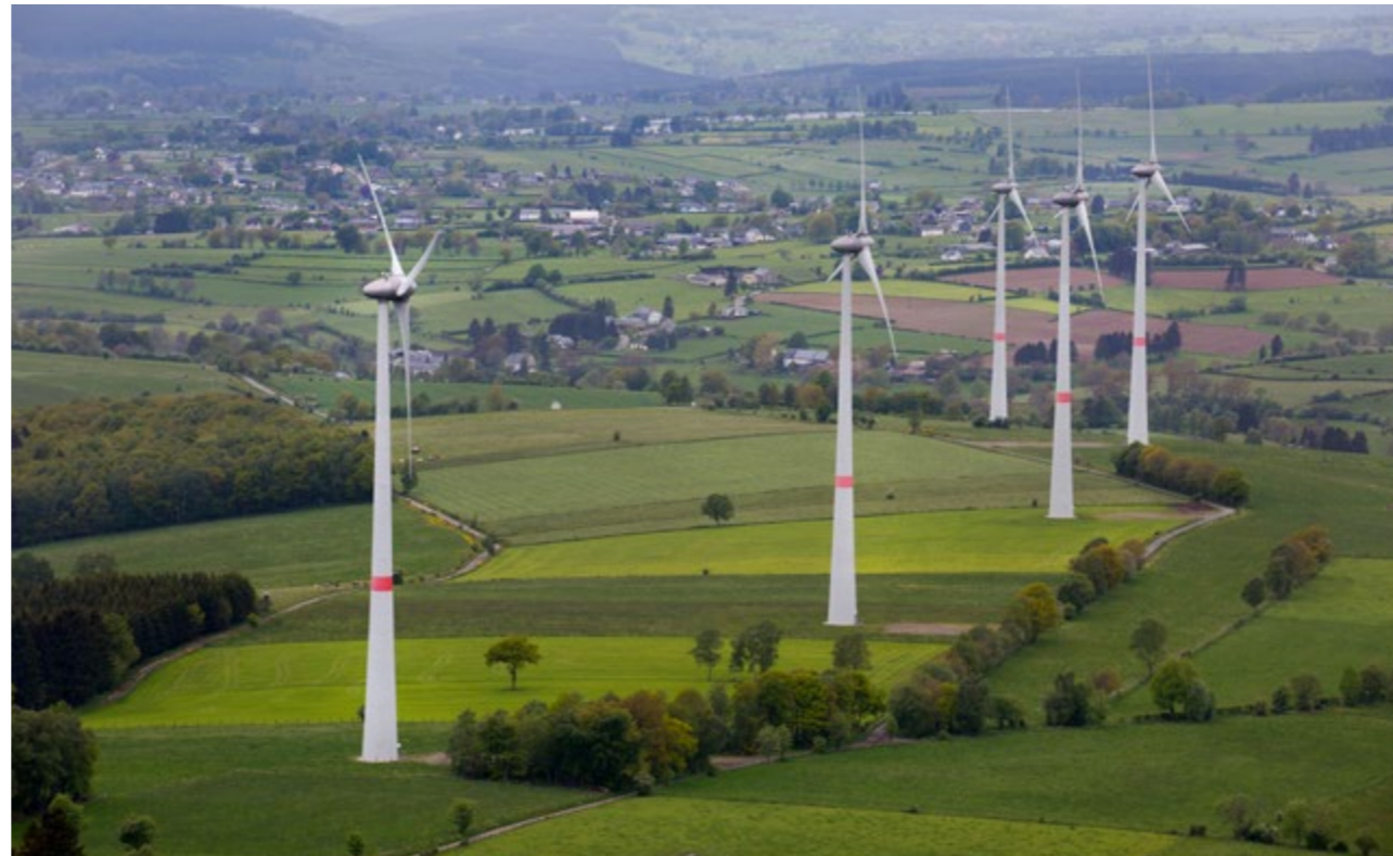
Windpark Amel 5 windturbines

Want daar gaat het bij Aspiravi om: bouwen aan een groen energiebeleid van de toekomst. Dat doen we samen met beleidsmakers, bedrijven en burgers. We moeten met z'n allen concrete stappen zetten om de noodzakelijke energietransitie te realiseren. Samen maken we er werk van!