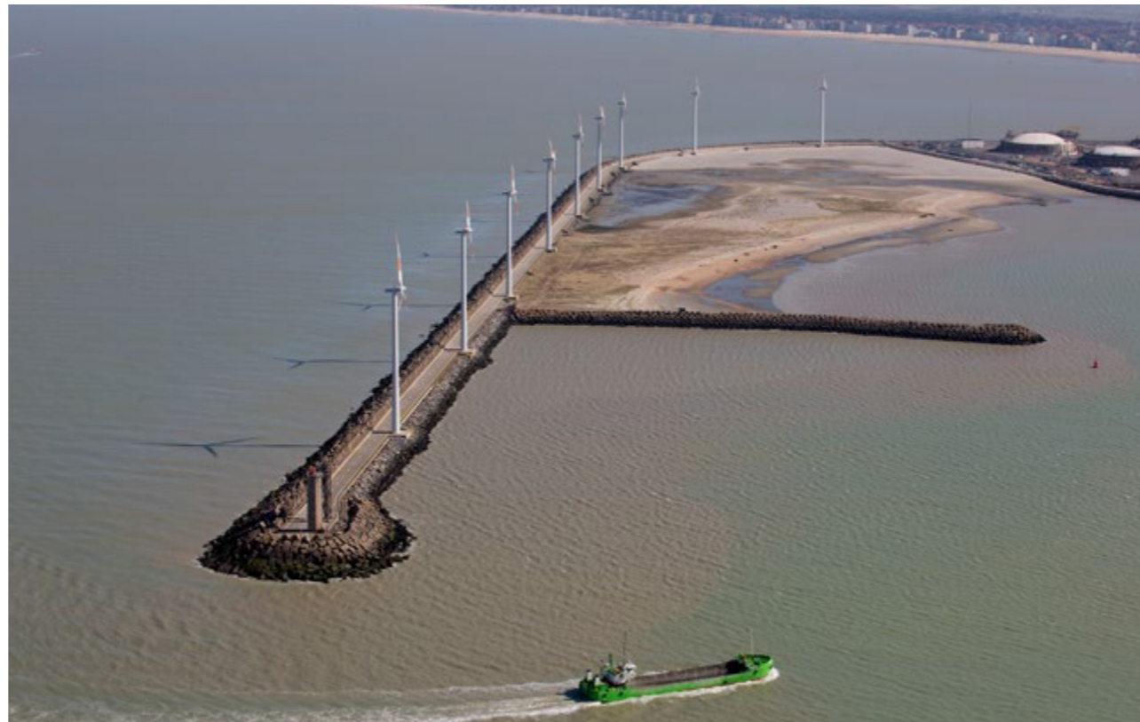
Windpark Zeebrugge 10 windturbines op de oostelijke strekdam