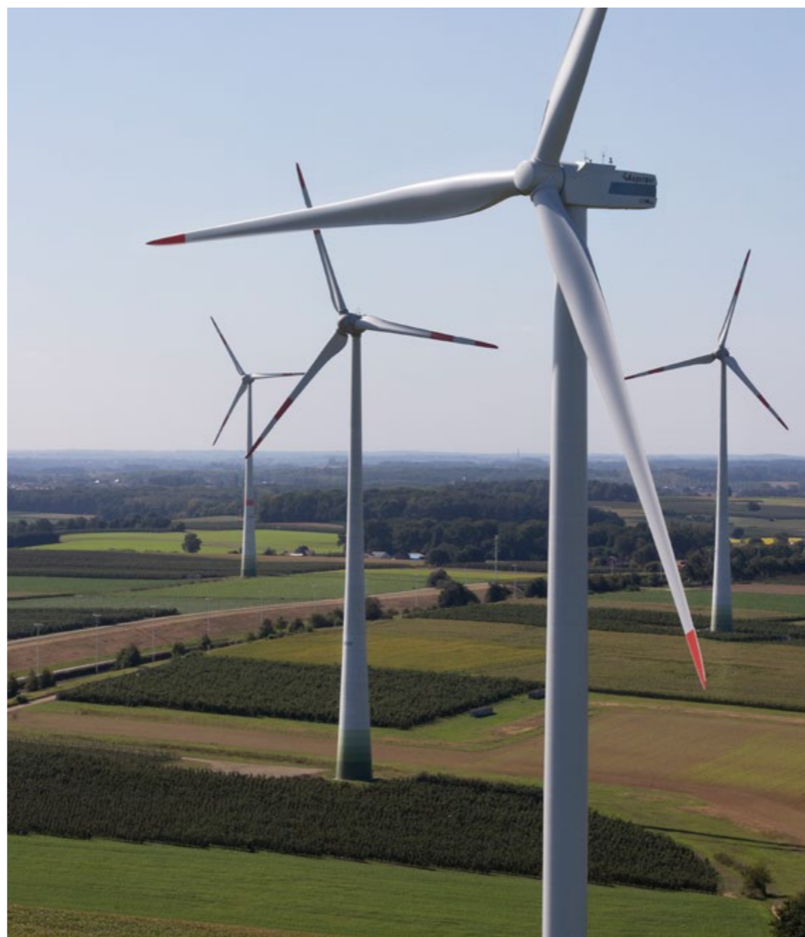
Windparken Halen, Diest, Bekkevoort, Scherpenheuvel-Zichem 13 windturbines langs de snelweg E314

Ook in 2021/2022 draagt de Aspiravi-groep bij aan meer hernieuwbare energie. In totaal bouwen we 35 nieuwe windturbines op land in België. Die staan op 10 locaties in 5 verschillende provincies. Met de bouw van deze nieuwe projecten gaat een totale investering van 120 miljoen euro gepaard. Een mooie investering in de groei van de Aspiravi-groep ( profit ), maar ook in de groei van een meer duurzame samenleving ( planet )! Alle nieuwe projecten samen zullen groene stroom produceren equivalent aan het gemiddeld jaarlijks verbruik van bijna 95.000 gezinnen ( people ). De 35 windturbines zullen bovendien een jaarlijkse CO 2 -uitstoot van 135.000 ton vermijden.