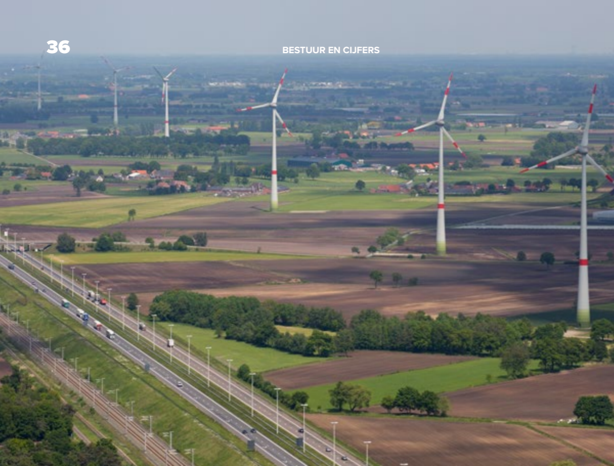
Windparken 'Noorderkempen' Brecht, Wuustwezel, Hoogstraten 12 windturbines langs de snelweg E19 en de hogesnelheidslijn