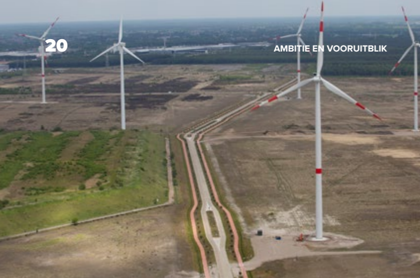
Windpark Lommel 13 windturbines op industrieterrein Kristalpark