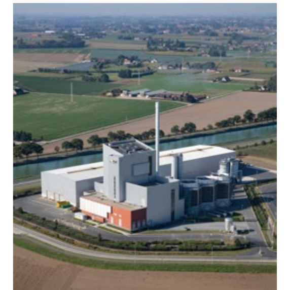
A&S Energie Oostrozebeke Centrale voor niet-recycleerbaar houtafval