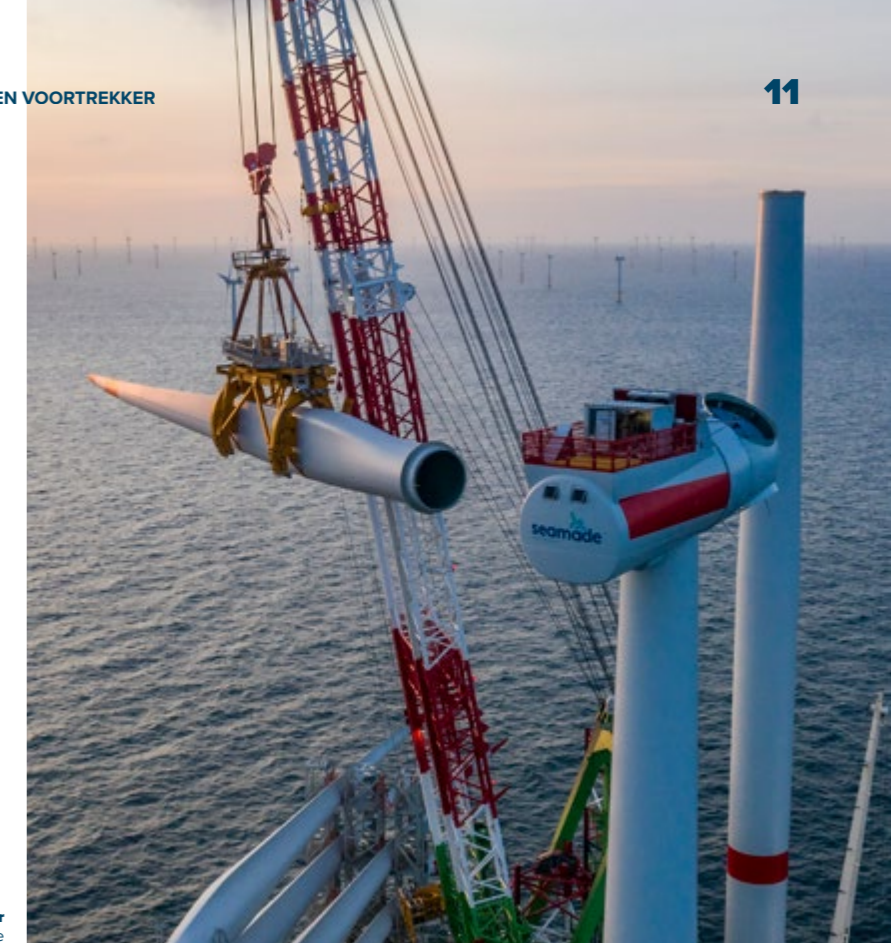
Windpark Seastar 30 windturbines in de Belgische Noordzee

Een overzicht van en extra informatie over al onze projecten in exploitatie, in opbouw en in ontwikkeling/procedure vindt u op de individuele projectpagina's op www.aspiravi.be .