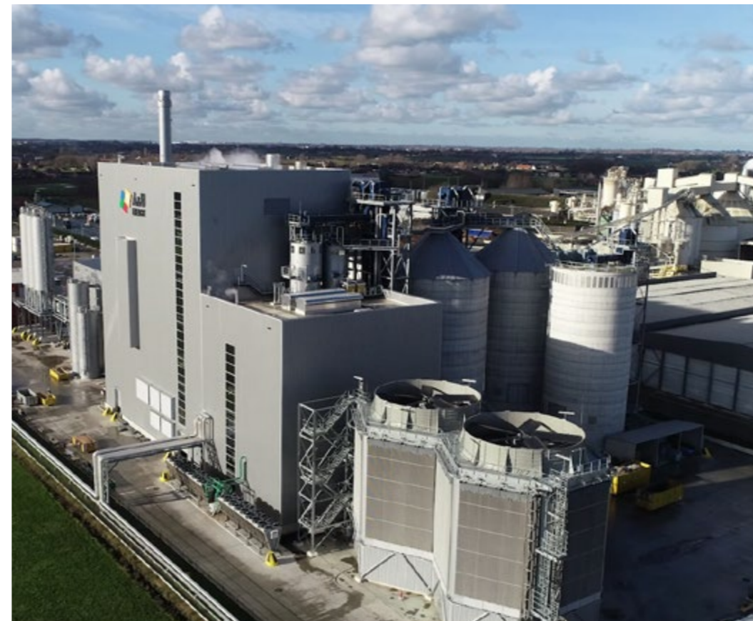
A&U Energie Wielsbeke Centrale voor niet-recycleerbaar houtafval