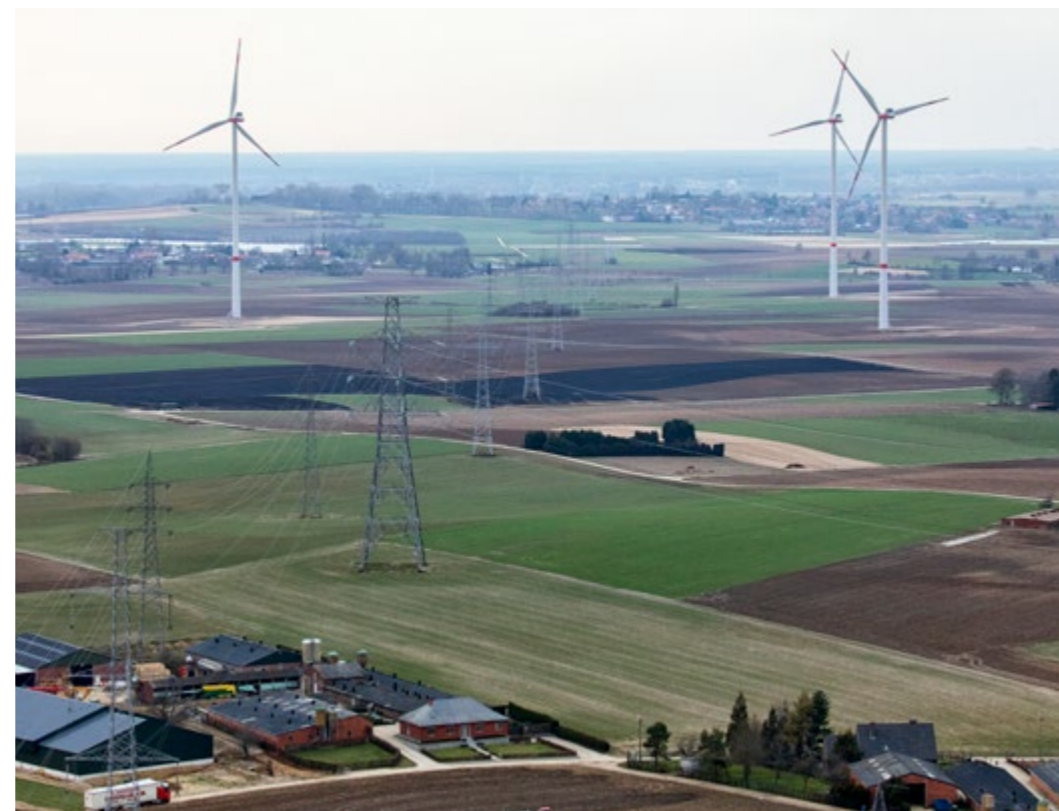
Windpark Riemst, Bilzen 3 windturbines gebundeld met o.a. de hoogspanningslijn