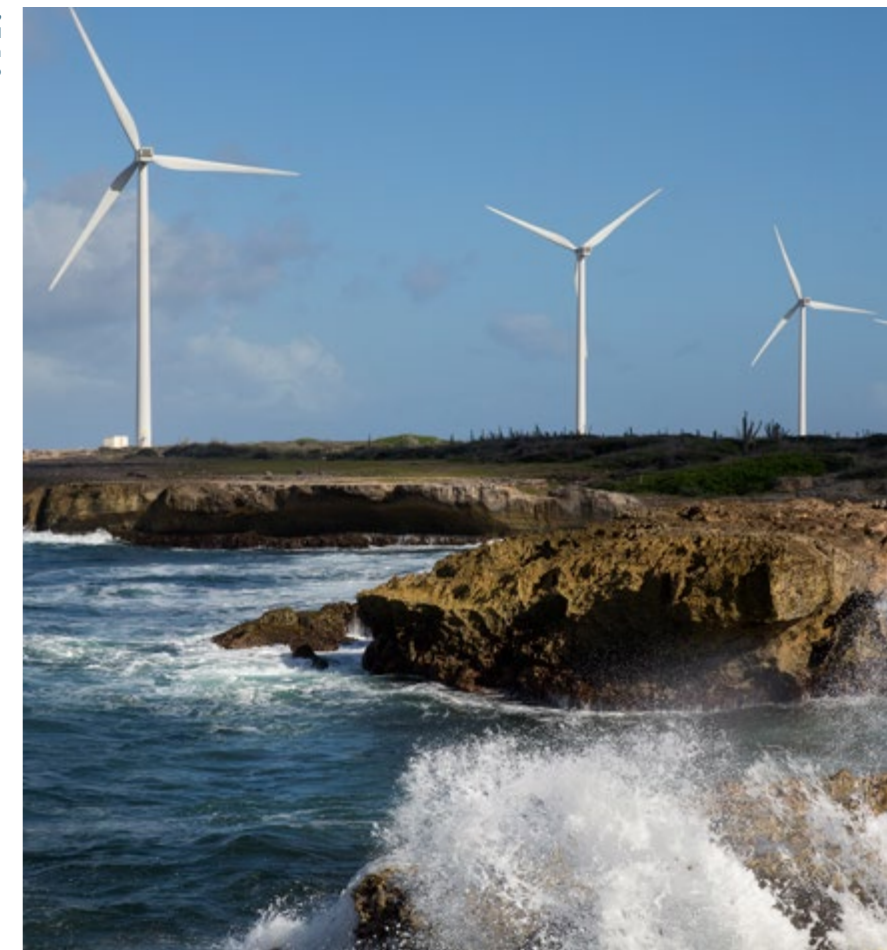
Windparken Playa Kanoa, Tera Kora I, Tera Kora II 15 windturbines langs de kustlijn op het eiland Curaçao

Ook de beide centrales o.b.v. niet-recycleerbaar houtafval dragen bij aan de economische ( profit ) en milieu- ( planet ) doelstellingen van de Aspiravi-groep. Niet alleen produceren de centrales groene stroom en groene warmte, ze lossen ook een bestaand afvalprobleem op.