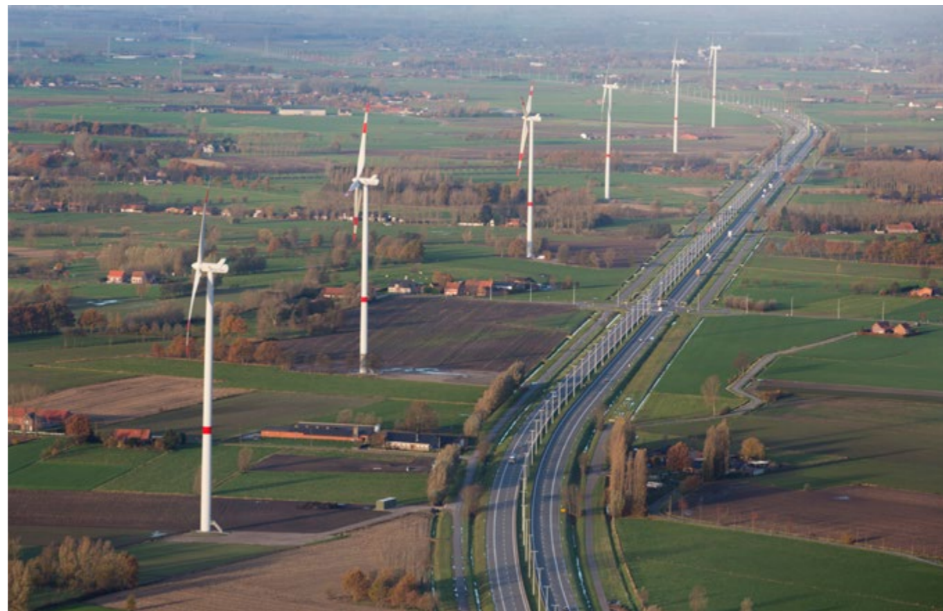
Windpark Assenede 6 windturbines langs de snelweg E34