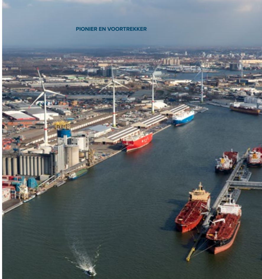
Windparken haven Antwerpen 34 windturbines op rechteroever en 21 op linkeroever